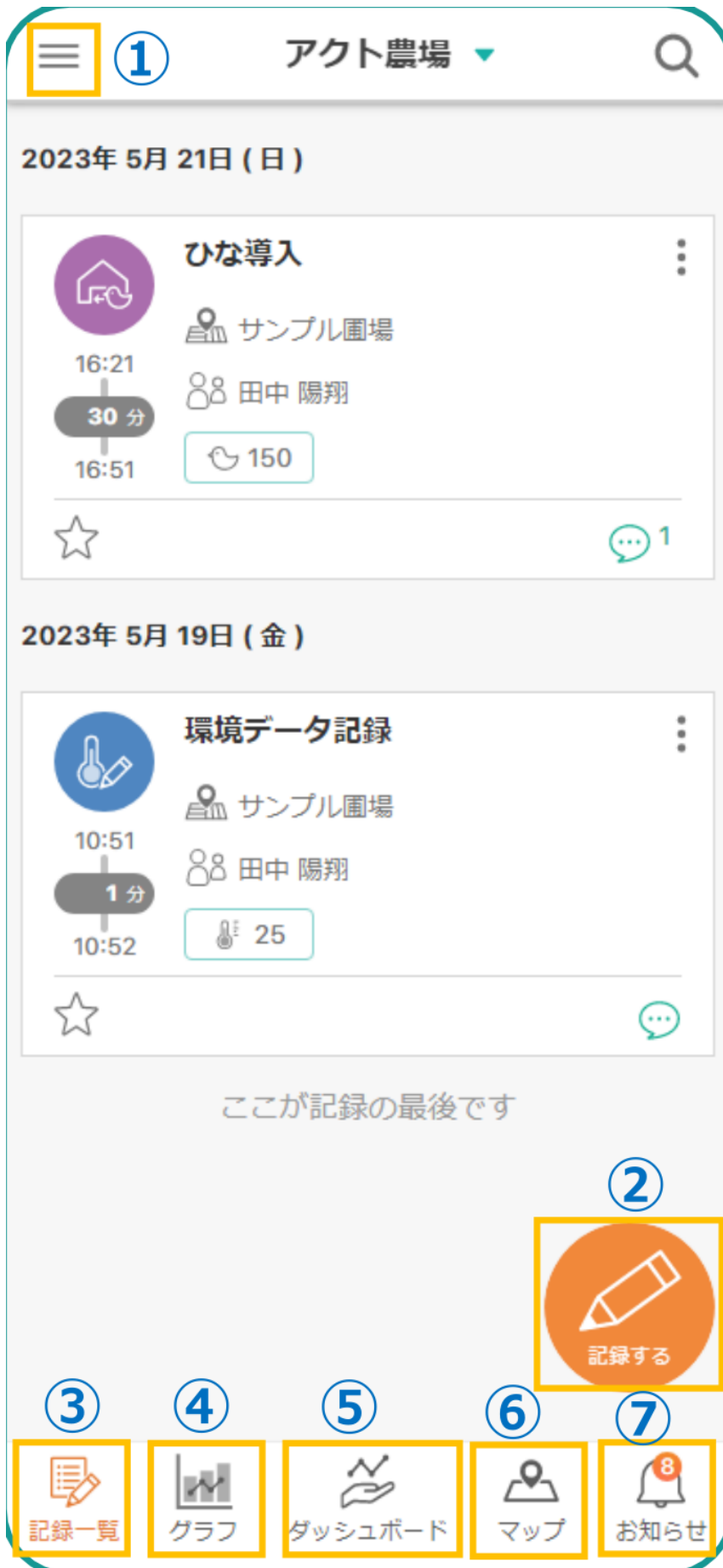
図2：メイン画面のボタン配置