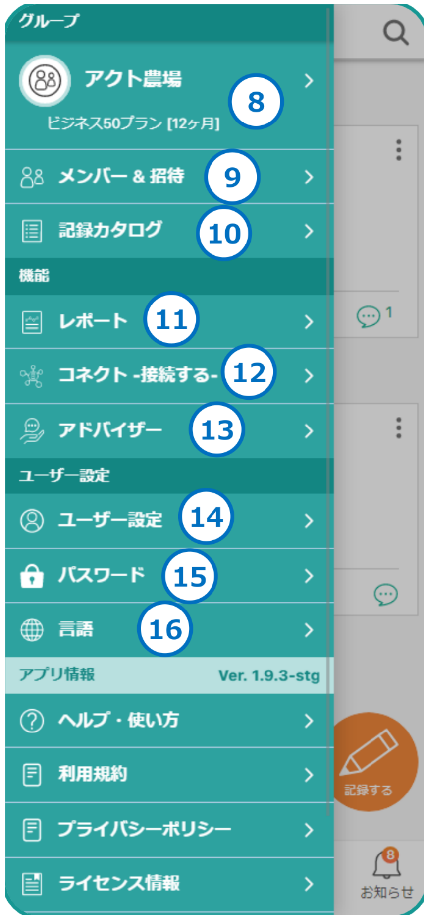
図3：メニュー内の機能一覧