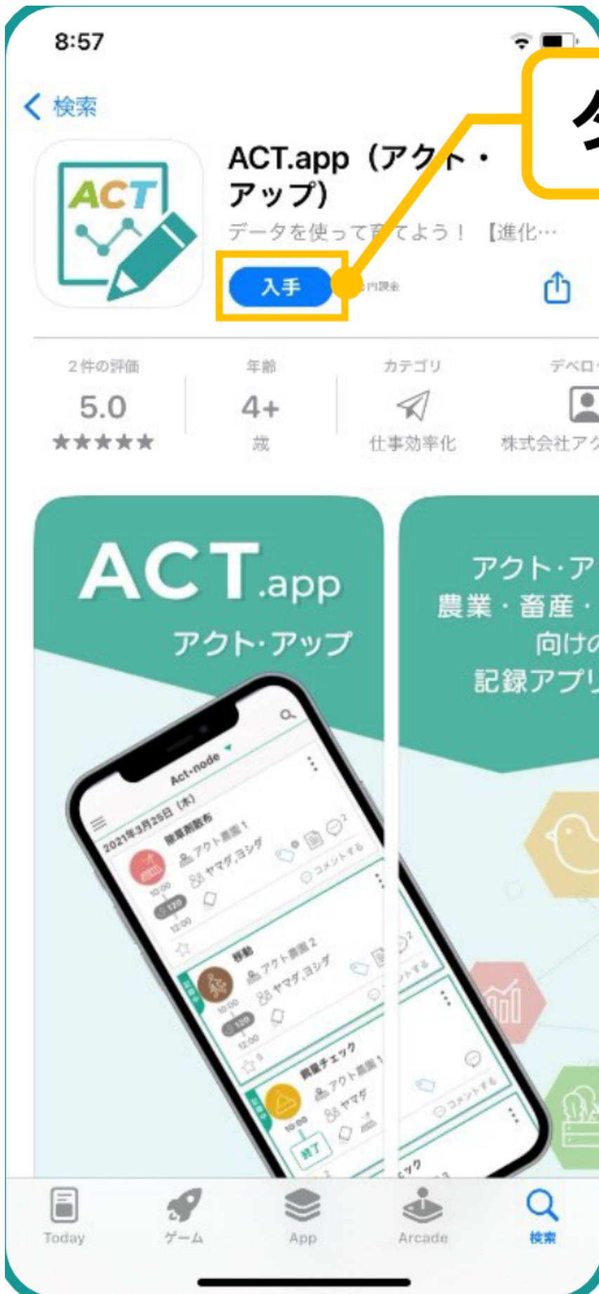
図1：App Store でのインストール画面