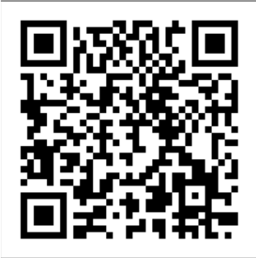
図5：メールアドレス入力