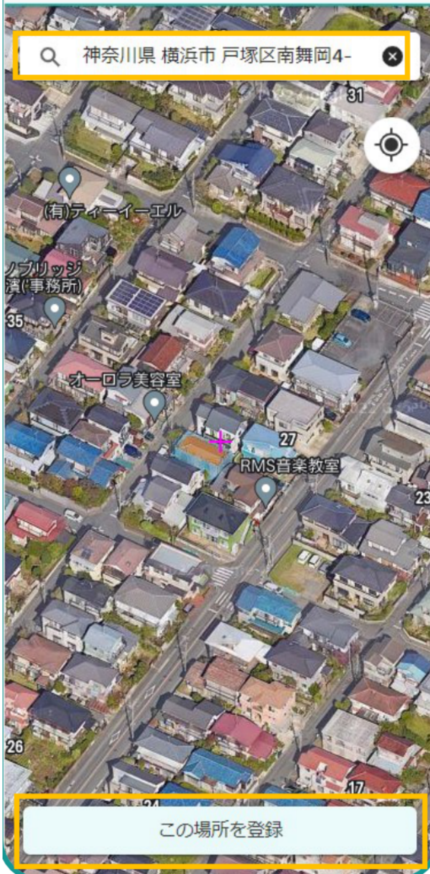
図14：初回ログイン後のホーム画面